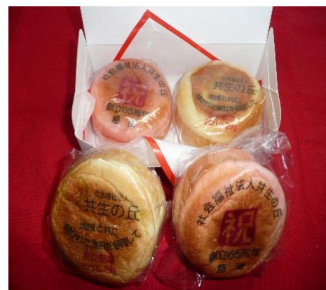
こちらが記念の紅白パンです。

65 周年を記念しまして、ささやかではありますが、就労支援事業部署よりパンを利用者様や近隣の皆様をはじめ関係者様にお贈りさせていただきました。これを機に役員・職員一同決意も新たに鋭意努力いたす所存でございます。今後ともご指導ご厚誼を賜りますようお願いいたします。